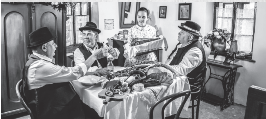
Zajlik a készülődés, az ételmet is le kell tesztelni

Lesz sörsátor is, ahova kivonul a Staropramen sörgyár az összes termékével, valamint két kisvonat fuvarozza majd az embereket Dunaszerdahelyről a Nemeshodosi Nagy Lakomára. Úgyhogy a szervezők mindenkit nagy szeretettel várnak és remélik, aki kilátogat augusztus 8-án Hodosba, felhőtlenül szórakozik majd.