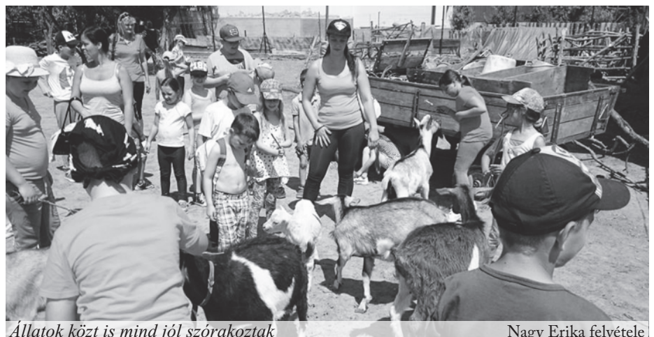
Állatok közt is mind jól szórakoztak

mukra. Hogy ne unatkozzanak a kicsik, a reggelt mindjárt kompozással kezdték, majd kecskét fejtek, lovaskocsikáztak, tízóraira gyógynövényes teákat és egészséges teasüteményeket fogyaszthattak,