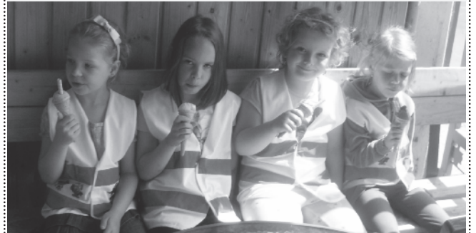
Buszoszás után a megérdemelt fagyizás