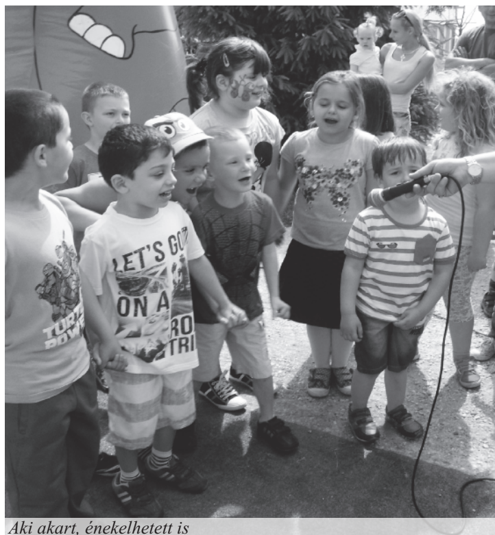
Aki akart, énekelhetett is

Ballagási ünnepségünkre június 19-én került sor, amikor 12 nagyóvodás intett búcsút az óvodás éveknél, az óvónéniknek és pajtásainak. Szeptembertől nyolc gyermek a helyi alapiskolák kisdíákja lesz, négyen pedig Dunaszerdahelyen kezdik meg az iskolát. Jó tanulást kívánunk nekik!