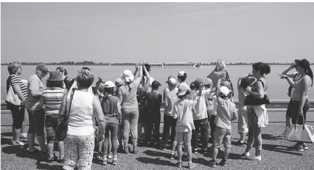
Deti pri Dunaji, potom „konečne“ na kompe

Poobede si mohli vyskúšať vymývanie zlata na Dunaji a prešli nekonečne dlhým turistickým výchovným chodníkom, ktorý im pripadal ako džungľa. Na záver dňa dorazili domov unavení, ale plní nezabudnuteľných zážitkov.