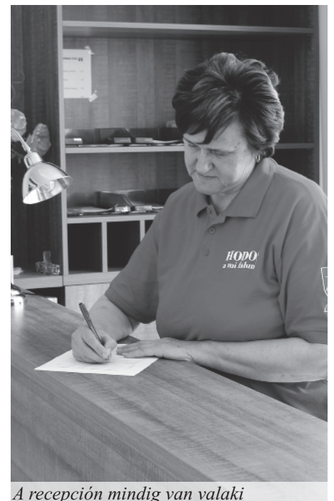
A recepción mindig van valaki