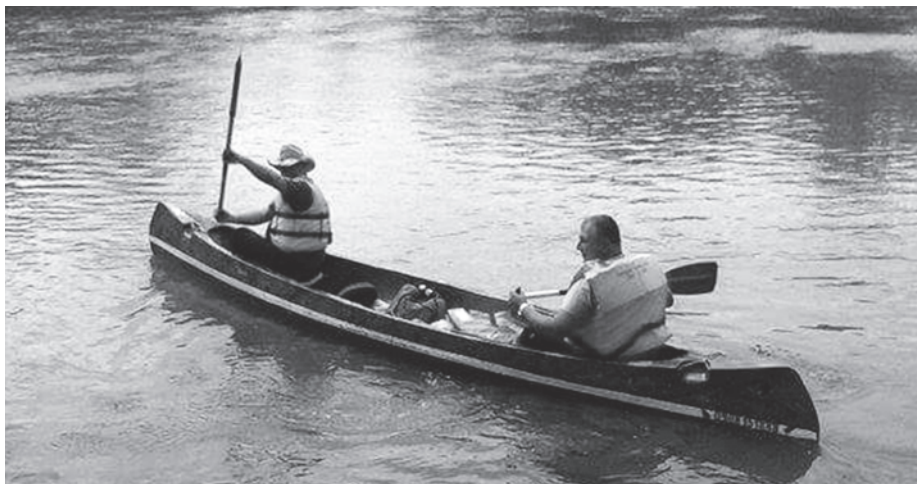
Többen legközelebb is elmennének

több is, csak egy csónak maradt belül szárazon, kettő szinte teljesen elázott. Több mobiltelefon is bánta az utat, de még így is többen azt kérdezték, mikor lesz a következő túra. Irma azt mondja, utólag vicces visszagondolni a történetekre. „Még így is van rá érdeklődő, úgyhogy ha valaki akarja, megszervezzük, de mindenképpen máshogy állunk majd hozzá. Ez is egy tapasztalat volt, kellett ahhoz, hogy ha legközelebb is elmegyünk, már tudjuk, mire vállalkozunk” – zárja a beszámolót a klubelnök.