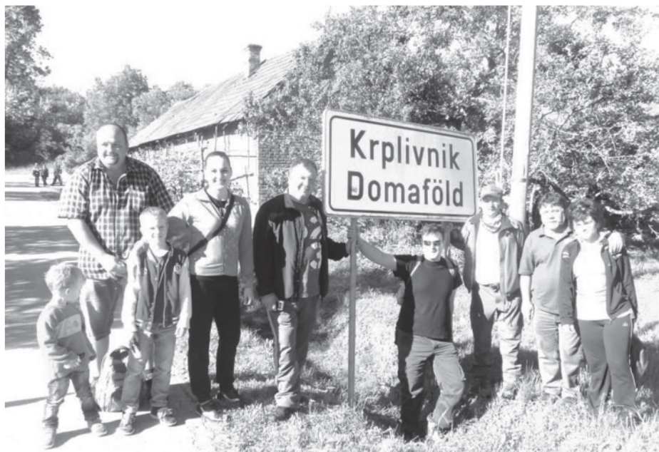
A hodosiak csapata