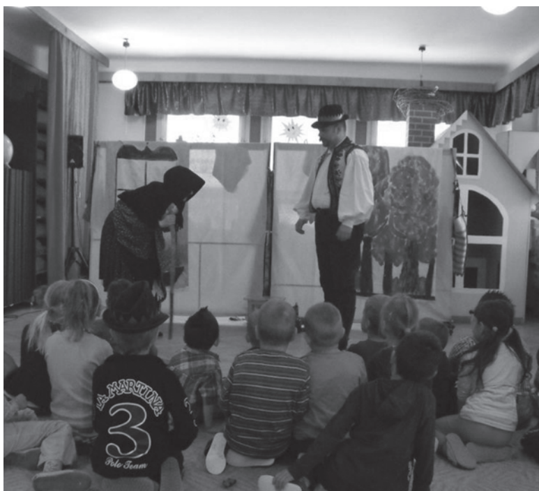
A Kuttyomfitty Társulat műsora

A gyereknapi az oviban június 5-én tartották, amikor az ekecsi Kuttyomfitty Társulat az Elvarázsolt királykisasszony című mesejátékot adta elő. Az interaktív előadásba a gyerekeket és a tanító néniket is bekapcsolták, így mindenki kivette a részét a programból. Az előadás után népi tánc ház zajlott, ahol a kicsik megismerkedhettek a népi tánc lépésekkel.