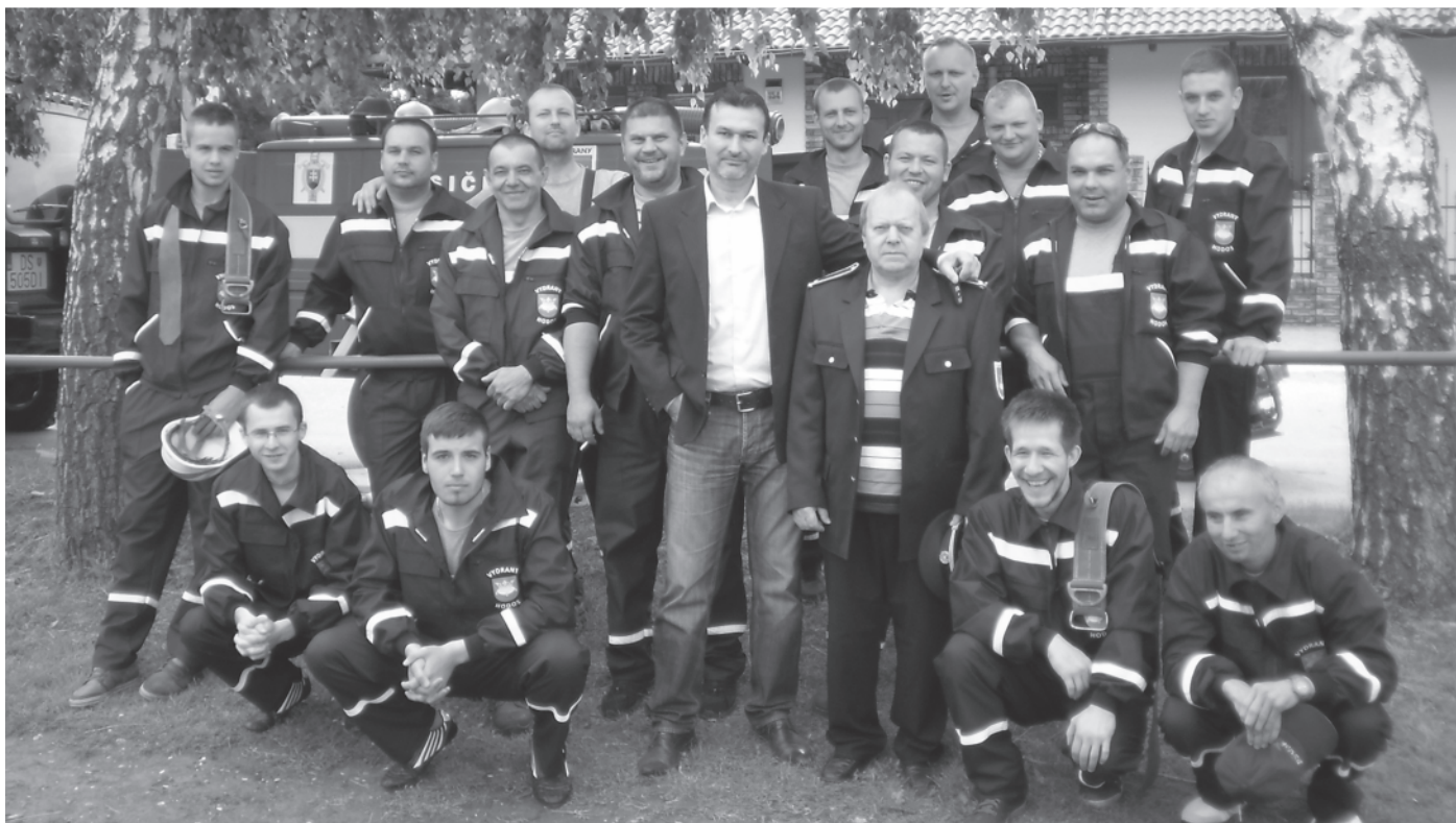
A hodosi önkéntes tűzoltók