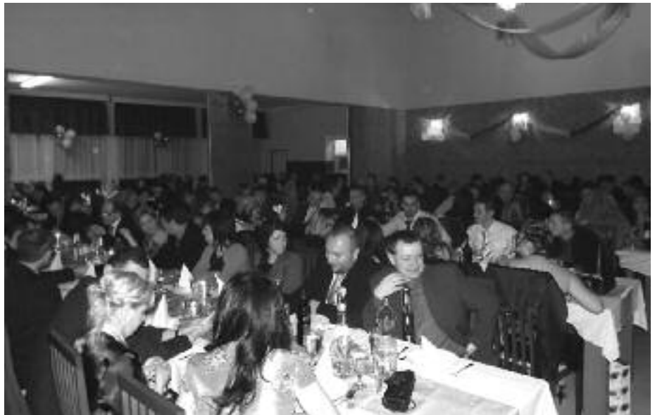
Fergeteges hangulat jellemezte az idei ovibált is

Nem volt ez másként az idei, immár hagyományos, a hodosi óvoda szülői közössége által rendezett farsangi bálon sem, amelyre január 26-án került sor a helyi kultúrházban. A rendező szülők minden tiszteletet megérdemelnek, mert kitűnően vizsgáztak segítőkészségből és a gyermekeikért való „tenniakarásból”. Az elmúlt sikeres bálók tapasztalataiból kiindulva az óvoda vezetésével együttműködve egy emberként vették ki részüket az előkészületi munkálatokból, amelyeknek nemcsak akarat, de anyagi feltételei is vannak. Mindenek csúcspontja volt a bálterem díszítése, ahol anyukák és apukák segítettek. Szponzorok jóvoltából remek tomboladíjak, ínycsiklandozó menü, kiváló zene lett biztosítva és már kezdődhetett is a multság, amelyen 152 régi és új vendég vett részt. A jó hangulatról Ürögi László vezetésével a For You zenekar gondoskodott. Ezen az éjszakán