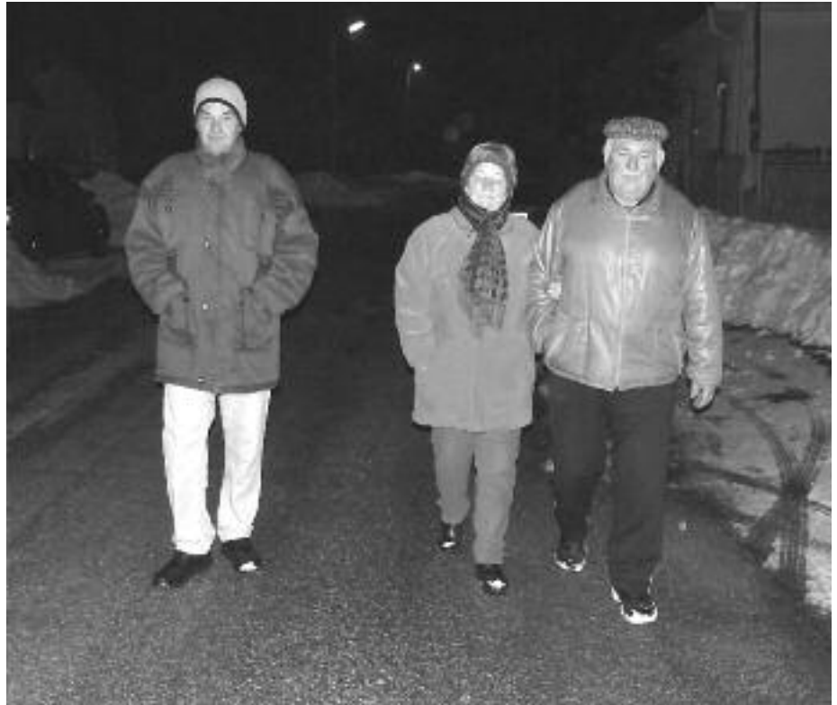
Indulhat az esti séta

ban nem ég a lámpa, de az esetek 99 százalékában a televízió fénye pislákol a házban. Pedig nem csak az létezik a világon, hiszen néha, sőt, inkább rendszeresen a séta is fiatalon tartja az embereket. Nem csak nyáron lehet mozogni, sportolni, de télen is. Hiszen a séta, mint olyan, az is sportnak számít.