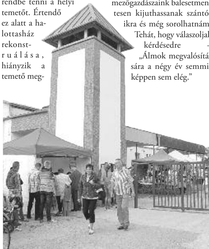
Az emlékeket hordozó kilátótorny

„Álmok megvalósítására a négy év semmiképpen sem elég.”