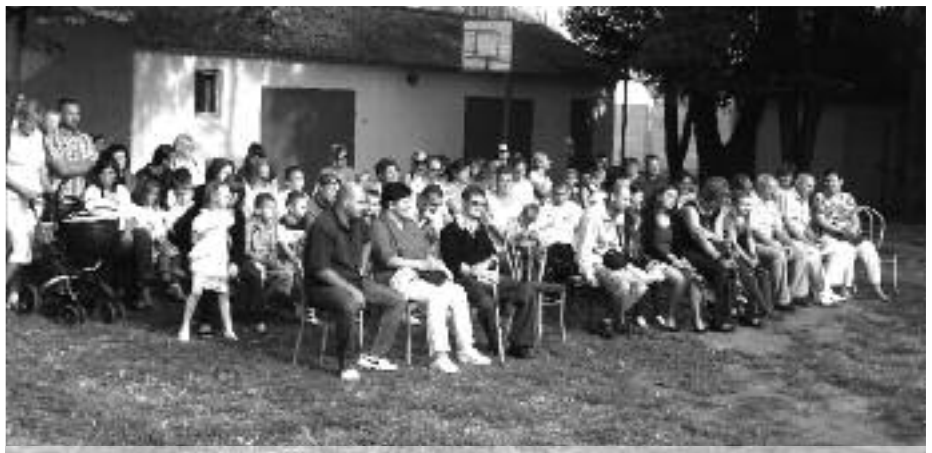
Kiselsősök és szülei az iskolai évnyitón

Új évet kezdtünk, de nem árt, ha néha visszatekintünk és megnézzük, hogyan alakult a község lakosságának a száma az utóbbi években. Annyit mindenképpen megállapíthatunk, hogy a lakosság száma az eltelt évek alatt, pontosabban 2001 óta közel 150-el nőtt.