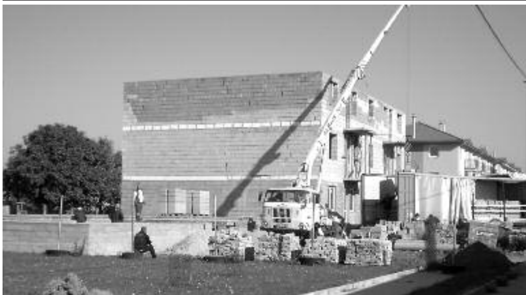
Épülő bérházak a község peremén