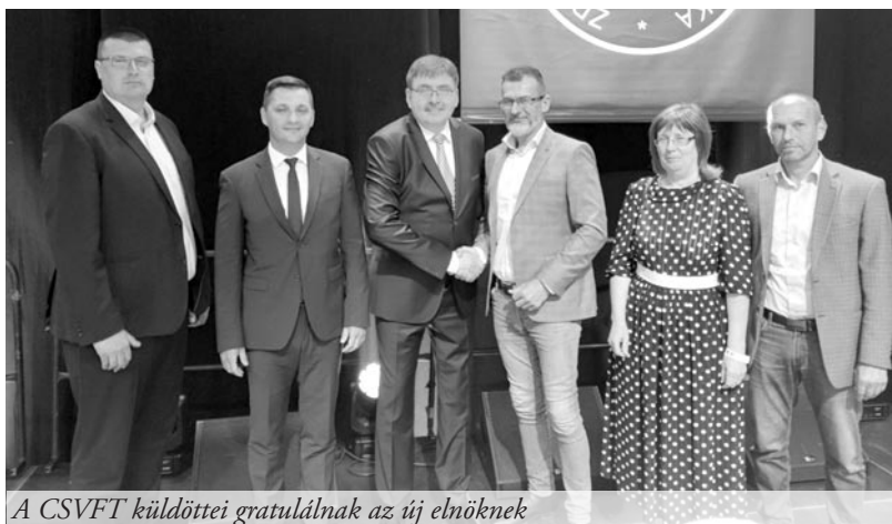
A CSVFT küldöttjei gratulálnak az új elnöknek