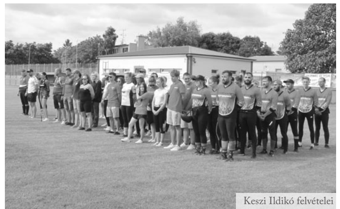
Keszi Ildikó felvételei

Június utolsó hétvégéjén került sor a hagyományos hazai tűzoltóversenyre, ahol két versenyszámban indultak az önkéntes tűzoltók csapatai. Az első versenyszámra az egész megyéből érkeztek a csapatok, míg a másodikra inkább a környékbeli önkéntesek neveztek.