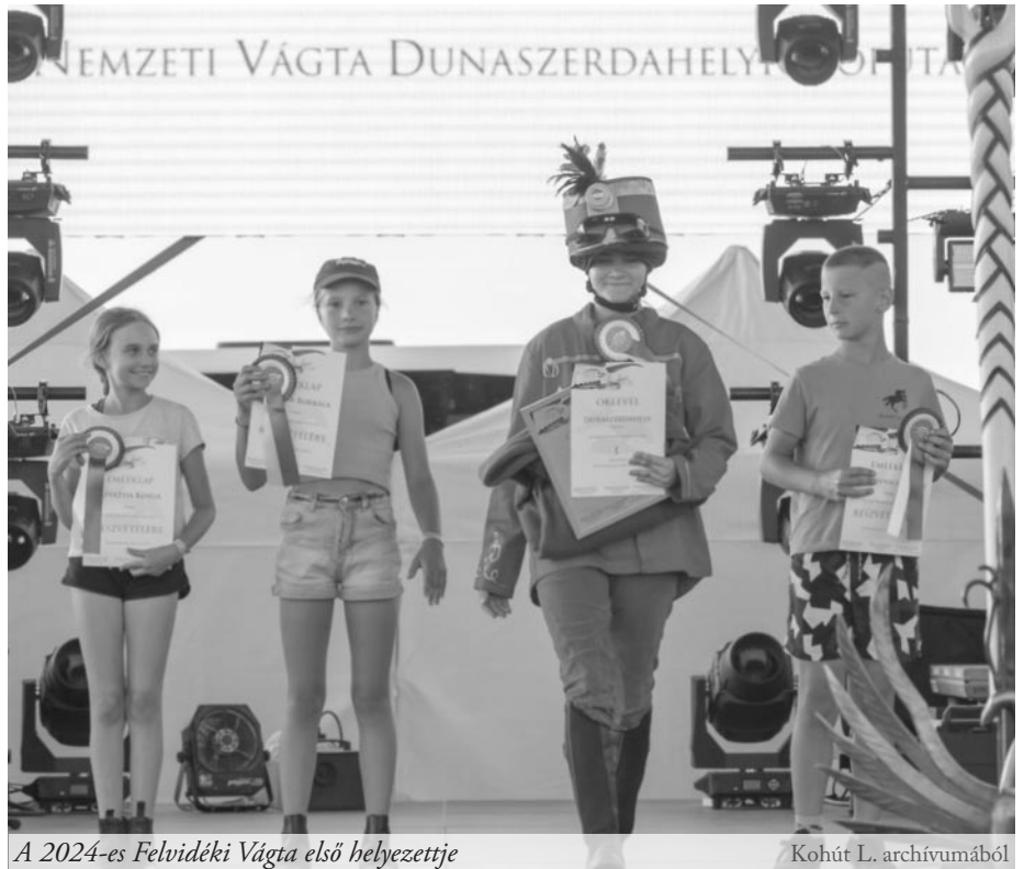
A 2024-es Felvidéki Vágtá első helyezettje