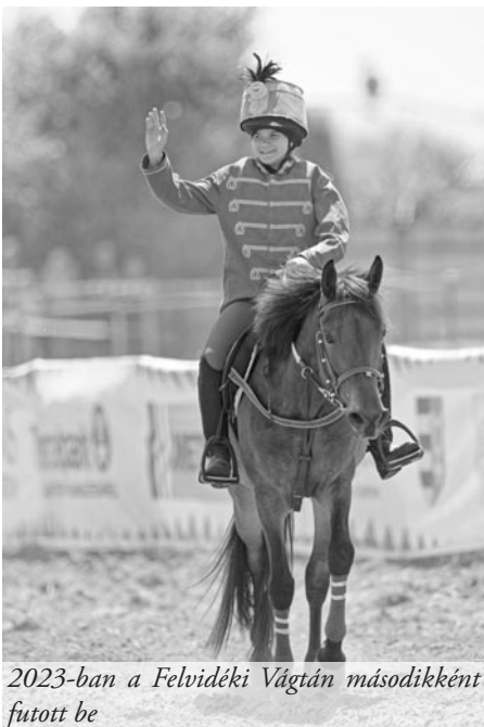
2023-ban a Felvidéki Vágtán másodikként futott be

Már kiskorom óta az életem része volt a sport és a mozgás. Először kézilabdáztam a DAC csapatánál, de nem éreztem azt,