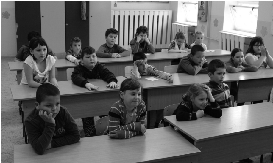
A legfontosabbak – a jövő nemzedéke

Ahogy azt már a lakosok is megszokhatták, az év elején megvizsgáljuk, miként változott a község lakosságának összetétele az elmúlt évben és összehasonlítva az utóbbi esztendővel.