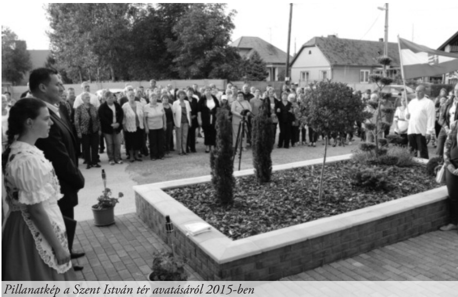
Pillanatkép a Szent István tér avatásáról 2015-ben

Gondolva a falu növekedésére, s mivel az élethez a távozás is hozzátartozik, a temetőt is rendbe tették, és jelentősen kibővítették. A régi időkben a járás gyöngyszeme volt a hodosi művelődési ház, csak hát idővel sokat romlott az állaga. Az elmúlt három évben pazarul felújították, s a község ékkövévé vált. Jellemző, hogy egy évre előre le van foglalva minden hétfélig. Előtte zöld szigetekkel tarkított teret alakítottak ki, s mivel a község első teréről van szó, Szent István királyunkról nevezték el. Természetesen itt zajlanak a központi rendezvények. A falu egész területén sikerült felújítani a közvilágítást, míg a 15 térfelügyelő kamera a közbiztonságot szolgálja. Ugyancsak az utóbbi két év hozadéka a kétszobás panzió, amely 23 személy befogadására alkalmas, és hét helyiséggel várja a turistákat. A nagyobb lélegzetű munkák közül említést érdemel még az