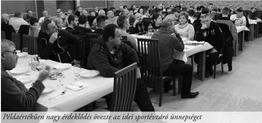
Példaértékűen nagy érdeklődés övezte az idei sportévszázó ünnepséget

Január 21-én, szombaton Hodosban az elmúlt időszak sikereit, eredményeit értékelték, a jövő legfontosabb feladatait tervezgették, az esélyeket latolgatták a helybéli futballklub évszázó taggyűlésén.