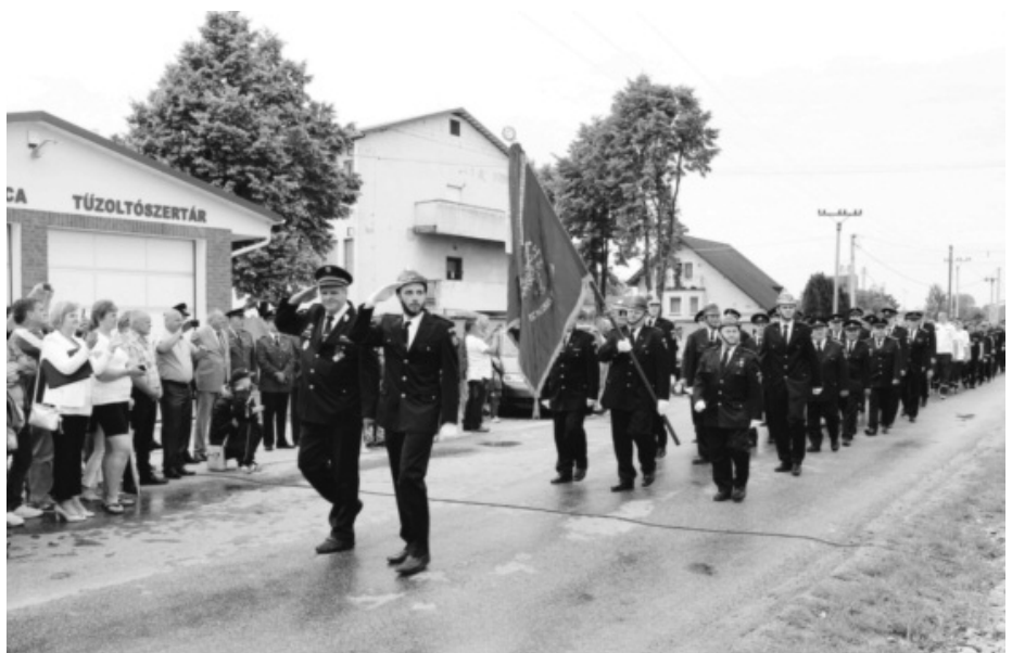
A közösségépítés kiváló példája a tűzoltó-szertár átadási ünnepsége

A kultúra terén három pillért tart fontosnak a polgármester. Elsőként az idén jubiláló helyi újságot említi, amely tíz éve minden hónapban megjelenik. Másodikként a már említett énekkart, amely mindig úton van, és szívvel-lélekkel viszi szét a világba a falu hírnevét. S nem utolsósorban a Hodosi lakoma nevű kulturális fesztivált, amelyet immár országsszerte ismernek, s amely – az elmúlt évekhez hasonlóan – idén is 14 ezer látogatót vonzott a településre. Dicséri az önkéntes tűzoltók csapatát is, akik összetartó közösséget alkotnak, és jövőre be akarnak nevezni a nyugat-szlovákiai ligába. Mi sem természetesebb, mint hogy új tűzoltószertár épült számukra, amelynek teljes a felszereltsége.