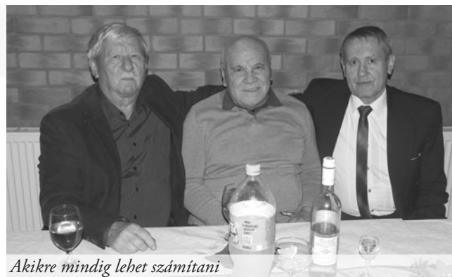
Akikre mindig lehet számítani

Nagyszerűen sikerült a helyi futballklub bálja, melyre november 18-án került sor a helyi kultúrházban. A tavalyi hatvan vendéghez képest idén többen, mintegy nyolcvanan szórakoztak a rendezvényen. A klub vezetősége és edzője köszönetet mondott minden támogatónak, aki lehetővé tette és teszi a klub működését, így hozzásegítve őket a szép eredményekhez. A bálon meglepetésvendégként fellépett a Storyum zenekar, rengeteg tombola talált gazdára és a vendégek hajnalig szórakoztak.