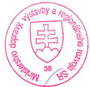
Ing. Ján Počiatek minister dopravy, výstavby a regionálneho rozvoja SR